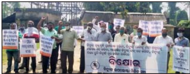
କନ୍ଦରପୁରଠାରେ ବିଦ୍ୟୁତ୍ ଉପଭୋକ୍ତା ମଞ୍ଚ ପକ୍ଷରୁ ବିକ୍ଷୋଭ

ରାଜ୍ୟର ବିଦ୍ୟୁତ୍ ସେବାର ଘରୋଇକରଣ ଓ ସେସୁକୁ ଟାଟା କମ୍ପାନୀକୁ ବିକ୍ରି କରାଯିବା, ବିଦ୍ୟୁତ୍ ଶୁଳ୍କ ବୃଦ୍ଧି, ପ୍ରସ୍ତାବିତ ଅନଲାଇନ୍ ପ୍ରିପେଡ୍ ବିଦ୍ୟୁତ୍ ଶୁଳ୍କ ଆଦାୟ, ରିହାତି ସମୟ ୧୫ ଦିନ ପରିବର୍ତ୍ତେ ୭ ଦିନକୁ ହ୍ରାସ କରିବା, ଘନଘନ ଅପୋଷିତ ବିଜୁଳି କାଟ, ଲୋ ଭୋଲଟେଜ୍, ବିଜୁଳି ବିଲରେ ତ୍ରୁଟି, ବିଦ୍ୟୁତ୍ ଭିଡିଓମିଟର ବିପର୍ଯ୍ୟୟ ଅବସ୍ଥା ଓ ବେଆଇନ୍ ବିଦ୍ୟୁତ୍‌ବିଲ ଆଦାୟ ବିରୁଦ୍ଧରେ ସମସ୍ତ ସ୍ତରର ଜନସାଧାରଣଙ୍କୁ ଏକତ୍ର କରି ଆନ୍ଦୋଳନ ଗଢ଼ିତୋଳିବା ପାଇଁ କଟକ ଜିଲ୍ଲା ସ୍ତରୀୟ “ବିଦ୍ୟୁତ୍ ଉପଭୋକ୍ତା ମିଳିତ ମଞ୍ଚ” ଗଠନ କରାଯାଇଛି । ଏହି ମଞ୍ଚ ନେତୃତ୍ୱରେ କଟକ ଜିଲ୍ଲାର ବିଭିନ୍ନ ବିଦ୍ୟୁତ୍ ଜେଲ ଓ ଏସଡିଓ ଅଫିସ୍ ସମ୍ମୁଖରେ ମଞ୍ଚ ନେତୃତ୍ୱରେ