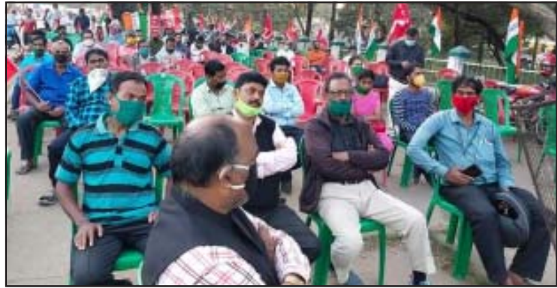
ରାଉରକେଲାଠାରେ ଅନୁଷ୍ଠିତ କନ୍ଭେନ୍ସନ୍ର ଏକାଂଶ

କେନ୍ଦ୍ର ସରକାରଙ୍କର ଶ୍ରମିକ, କୃଷକ ଓ ଜନବିରୋଧୀ ନୀତି ବିରୋଧରେ ସଙ୍ଗଠିତ ହେବାକୁ ଯାଉଥିବା ଏହି ଧର୍ମଘଟକୁ ଓଡ଼ିଶା ରାଜ୍ୟରେ ସମ୍ପୂର୍ଣ୍ଣ ସଫଳ କରିବା ନିମନ୍ତେ କେନ୍ଦ୍ରୀୟ ଟ୍ରେଡ୍ ୟୁନିୟନ୍ ଓ କର୍ମଚାରୀ ଫେଡ୍ରେସନ୍‌ମାନଙ୍କ ମିଳିତ ଉଦ୍ୟୋଗରେ ରାଜ୍ୟ ସ୍ତରରେ ଓ ବିଭିନ୍ନ ଜିଲ୍ଲାସ୍ତରୀୟ ମିଳିତ କନ୍ଭେନ୍ସନ୍ ସଙ୍ଗଠିତ ହୋଇଯାଇଛି । ଭୁବନେଶ୍ୱର, କଟକ, ଖୋର୍ଦ୍ଧା, ବାରିପଦା, ଜଗତସିଂହପୁର, ରାଉରକେଲା, ଅନୁଗୁଳ, ଭଦ୍ରକ, ବାଲେଶ୍ୱର, ଜୟପୁର, ଯାଜପୁର ରୋଡ୍ ପ୍ରଭୃତି ସ୍ଥାନରେ ଏହି ଧର୍ମଘଟ ମିଳିତ କନ୍ଭେନ୍ସନ୍ ମାନ ଅନୁଷ୍ଠିତ ହୋଇଯାଇଛି ।