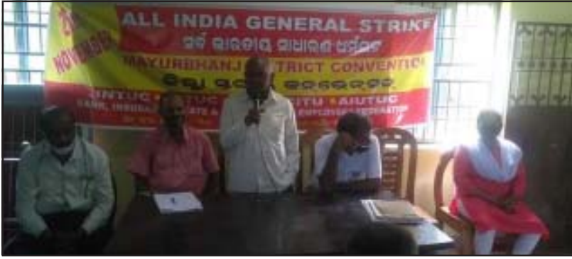
ବାରିପଦାଠାରେ ଶ୍ରମିକ ସଙ୍ଗଠନମାନଙ୍କର ମିଳିତ କନ୍ଭେନ୍ସନ୍

ଏ.ଆଇ.ୟୁ.ଟି.ୟୁ.ସି. ସମେତ ୧୦ଟି କେନ୍ଦ୍ରୀୟ ଟ୍ରେଡ୍ ୟୁନିୟନ୍ ଓ କର୍ମଚାରୀ ଫେଡ୍ରେସନ୍‌ମାନଙ୍କ ମିଳିତ ଆହ୍ୱାନରେ ୨୭ ନଭେମ୍ବର ୨୦୨୦ ସାରା ଭାରତ ସାଧାରଣ ଧର୍ମଘଟ ସଙ୍ଗଠିତ ହେବାକୁ ଯାଉଛି । ଶ୍ରମିକ ବିରୋଧୀ ଶ୍ରମକୋଡ, କୃଷକ ବିରୋଧୀ କୃଷି ଆଇନ, ଅତ୍ୟାବଶ୍ୟକ ସାମଗ୍ରୀ ଆଇନର ଜନବିରୋଧୀ ସଂଶୋଧନ, ବିଦ୍ୟୁତ୍ କର୍ମଚାରୀ ଓ ଉପଭୋକ୍ତା ବିରୋଧୀ ବିଦ୍ୟୁତ୍ ସଂଶୋଧନ ଆଇନ-୨୦୨୦, ଶିକ୍ଷା-ସଭ୍ୟତା ଧ୍ୱଂସକାରୀ ନୂତନ ଜାତୀୟ ଶିକ୍ଷାନୀତି-୨୦୨୦, ରେଳସେବା ସମେତ ରାଷ୍ଟ୍ରୀୟ ଉଦ୍ୟୋଗ ଓ ସରକାରୀ କ୍ଷେତ୍ରର ଘରୋଇକରଣ ଆଦି