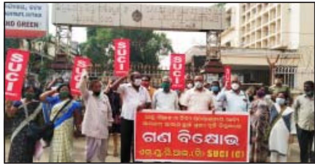
ବରବାମ ବୃଦ୍ଧି ପ୍ରତିବାଦରେ କଟକ ଜିଲ୍ଲାପାଳ କାର୍ଯ୍ୟାଳୟ ସମ୍ମୁଖରେ ବିକ୍ଷୋଭ

କରୋନା ସଙ୍କଟ ସମୟରେ ସମସ୍ତ ନିତ୍ୟବ୍ୟବହାରୀୟ ସାମଗ୍ରୀର ଆକାଶଛୁଆଁ ଦରବୃଦ୍ଧି ଫଳରେ ସାଧାରଣ ଲୋକର ବର୍ତ୍ତମାନ ବଞ୍ଚିବା ଅତ୍ୟନ୍ତ ଦୁର୍ଦ୍ଦିସ୍ତ ହୋଇପଡିଛି । ଆଜ୍ଞା, ପିଆଜ, ତାଳି, ତେଲ ଓ ପନି ପରିବାଠାରୁ ଆରମ୍ଭ କରି ପ୍ରତ୍ୟେକ ଖାଦ୍ୟ ସାମଗ୍ରୀର ଲଗାମହାନ ମୂଲ୍ୟ ବୃଦ୍ଧି ଘଟିଚାଲିଛି । ଅନ୍ୟ ଦିଗରେ ରାଜ୍ୟରେ ଲକ୍ଷ ଲକ୍ଷ ଲୋକ ଚାକିରୀ